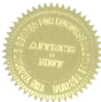
NGUYEN HONG THANG ASNT Level III Cer. No: 332059